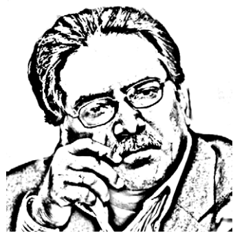
Klarer Sieger: Maoistenchef Prachanda.

Überhaupt wirkt er mit seinen eckigen Brillen und seinem Schnauzbart eher wie ein netter Lehrer als ein entschlossener Ex-Guerillakämpfer. Hatte Prachanda während des Wahlkampfes noch aggressive Töne angeschlagen, so sendet er nach der Wahl versöhnliche Signale aus. ■ Seite 8