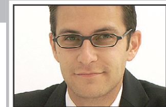
Der Autor ist Public Affairs-Berater und betreibt auch den liberalen Weblog www.ichbinsofrei.at .

Die Antwort darauf in zentral geplanten und bundeseinheitlich festgeschriebenen Lösungen zu suchen ist jedoch der falsche Weg. Was ist so schlecht an neun verschiedenen Bauordnungen? Oder was wäre so schlecht an neun verschiedenen Schulwesen? Gerade in einem kleinen Land wie Österreich könnte ein tatsächlicher Föderalismus ein gewaltiges Schwungrad für mehr Innovation, mutige Entscheidungen und Bürgernähe sein, da es relativ einfach ist, den Wohnort zu wechseln. Der größte Profiteur eines scharfen Wettbewerbs zwischen den Bundesländern, samt Steuerwettbewerb, wäre der Bürger. Denn kleine staatliche Einheiten wären gezwungenermaßen freie Volkswirtschaften mit großem Druck